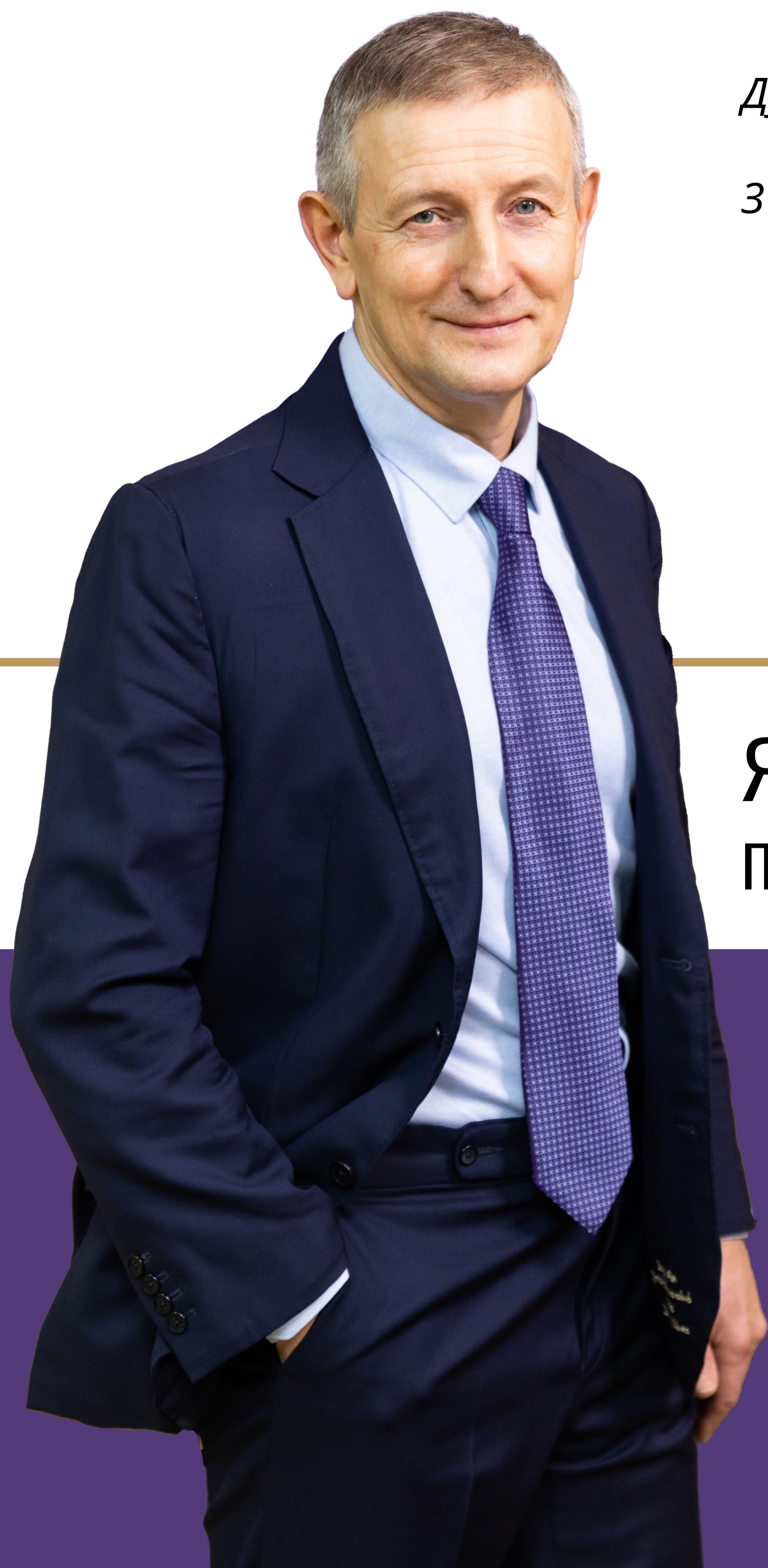
Ярослав Романчук Президент Міжнародного Інституту Свободи